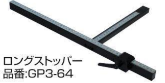
ロングストッパー 品番:GP3-64